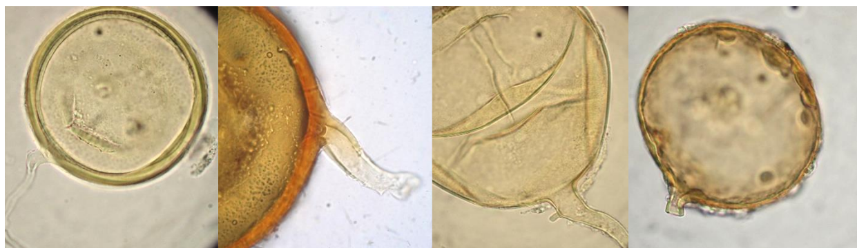
شکل ۴- اسپوره‌های آربوسکولار میکوریزای شناسایی شده در مزارع سیبزمینی. A. Claroideoglomus etunicatum , B. Funneliformis , C. Funneliformis mosseae , D. Glomus aggregatum (مقیاس ۱۰ میکرومتر)

بین مقدار N کل خاک با درصد همزیستی میکوریزا در ریشه سیبزمینی ارتباط قوی و معکوس معنی‌دار وجود دارد (شکل ۳).