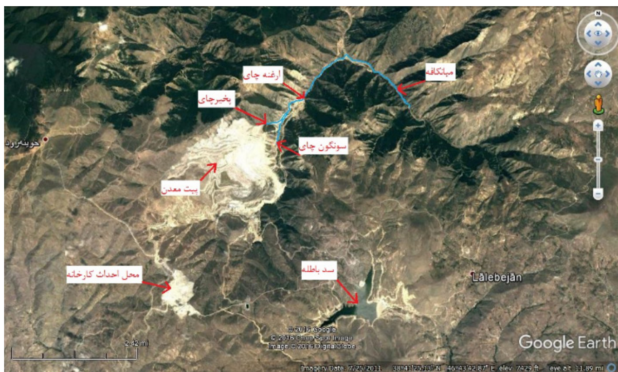
شکل ۱- عکس هوایی از مجتمع سونگون و محل تأسیس کارخانه

نامیده می‌شود و جز ناحیه اروپا-سیبری (منطقه هیرکانی) محسوب می‌شود. طبق مطالعات انجام شده، تاکنون بیش از ۱۳۴۴ گونه گیاهی در منطقه شناسایی شده است که به ۴۹۳ جنس و ۹۷ تیره تعلق دارند. از این تعداد ۸۰ گونه از آن‌ها جنگلی بوده و ۴۰ مورد جز گونه‌های دارویی مهم هستند. از مهم‌ترین گونه‌های جانوری ارسباران می‌توان خرس قهوه‌ای، پلنگ، سیاه‌گوش، گراز، کل بز، کبک دری، کبک چیل و قرقاول را نام برد. علاوه بر موردهای بالا، این منطقه زیستگاه یکی از پرندگان کمیاب ایرانی به نام «سیاه خروس» است. همچنین در پارک ملی ارسباران ۲۲۰ گونه پرنده، ۳۸ گونه خزنده، ۵ گونه دوزیست، ۴۸ گونه پستاندار (نظیر کل و بز، گراز، خرس قهوه‌ای، گوزن، آهو، گرگ، سیاه‌گوش و پلنگ) و ۲۲ گونه ماهی شناخته شده است (Bangian and Osanloo, 2008). شهرستان ورزقان دارای دو بخش مرکزی و خاروانا، دو نقطه شهری به نام‌های ورزقان و خاروانا و ۱۵۷ روستا است که از این تعداد حدود ۳۱ روستا در اطراف مجتمع مس سونگون قرار دارند. بر اساس نتایج سرشماری عمومی نفوس و مسکن در سال ۱۳۹۵ جمعیت شهرستان ورزقان ۵۲ هزار