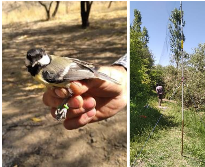
شکل ۲- (سمت راست) تور پرنده‌گیری نصب شده در مسیر تردد پرندگان و (سمت چپ) چرخ‌ریسک بزرگ ( Parus major ) به همراه حلقه‌های سیلیکونی سبز رنگ در هر دو پا