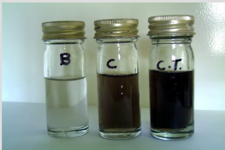
شکل ۲- محلول سانتریفوژ شده و فیلتر شده حاصل از فرایند محلول سازی ذغال سنگ بوسیله کنسرسیونم باکتریایی. B: شاهد بدون تلقیح باکتری، C: ذغال سنگ پودر شده، و C.T.: پس مانده های ذغال شویی

شکل ۲ ذغال سنگ محلول شده را بعد از سانتریفوژ و فیلتر شدن نشان می دهد. در این تصویر، مایع حاصل از محلول سازی ضایعات ذغال شویی در مقایسه با ذغال سنگ پودر شده و شاهد بدون باکتری نشان داده شده است. سوبه های باکتریایی ضایعات ذغال شویی را بیشتر از ذغال سنگ پودر شده محلول سازی نمودند. به نظر می رسد علت این افزایش تأثیر pH و همچنین تبدلات کاتیونی ترکیبات همراه در ضایعات ذغال سنگی باشد. آزمایش اسپکتروفتومتری و وزن سنجی نیز نتایج فوق را تأیید می نماید (جدول ۱). همان طور که مشاهده می شود محلول حاصل از کشت کنسرسیونم باکتریایی بر روی ضایعات ذغال شویی ۱/۴۷۵ اختلاف جذب در طول موج ۴۵۰ نانومتر را نسبت به شاهد نشان می دهد در صورتی که این نتایج در مورد پودر ذغال سنگ ۰/۸۳۲