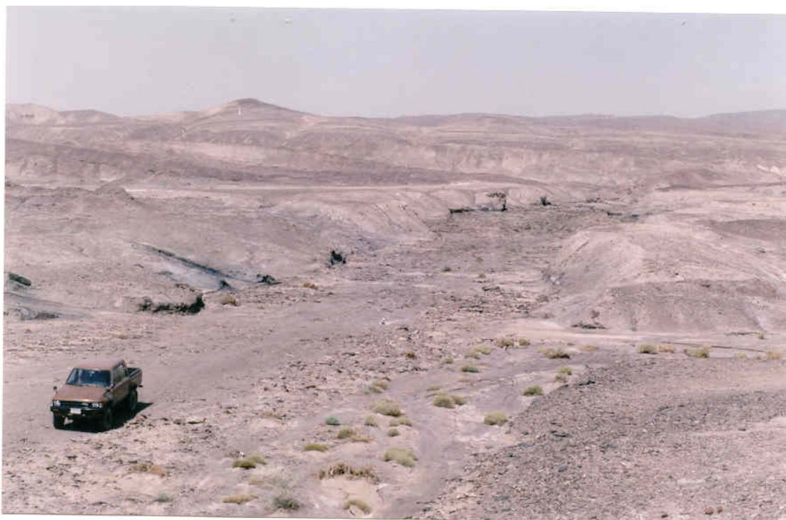
شکل ۳- نمائی از آبراهه‌های بخش غربی معدن مزینو (دید به سمت غرب)