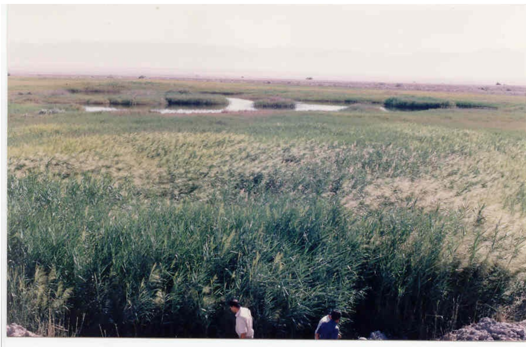
شکل ۴- نمائی از آبراهه‌های بخش غربی معدن مزینو (دید به سمت غرب)