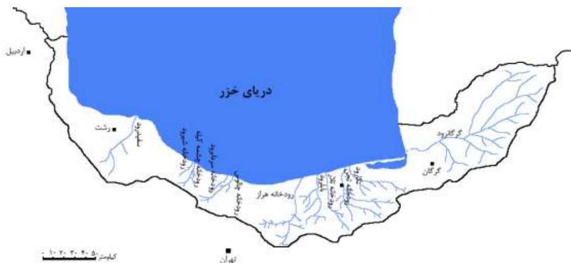
شکل ۱- موقعیت رودخانه‌های مهم در حوضه جنوبی دریای خزر Fig. 1- Location of important rivers in south of Caspian Sea

شامل گرگانرود، نکارود، تجن، تلار، بابلرود، هراز، رودخانه چالوس، سردابرو، رودخانه شیرو، سفیدرود رودخانه‌های مدنظر این تحقیق بودند. برای تهیه فهرست ماهیان غیربومی رودخانه‌های حوضه جنوبی دریای خزر از منابع موجود شامل (Abdoli, 1999; Abdoli and Naderi, 2009; Abdoli, 2015; Abbasi et al. , 1999; Abbasi 2019; Keivany et al. , 2016; Abdoli et al. , 1999; Kiabi et al. , 2022) استفاده شد. از ۱۵ گونه ماهیان غیربومی، ۱۴ گونه وارد رودخانه‌ها شده‌اند و یک گونه در حوضه جنوبی دریای خزر پرورش داده می‌شود ولی وارد اکوسیستم رودخانه نشده است و در این مطالعه به‌عنوان گونه افق در نظر گرفته می‌شود. منظور از گونه افق، گونه ماهی غیربومی است که در مجاورت منطقه ارزیابی ریسک (رودخانه‌ها) وجود دارد ولی هنوز وارد منطقه ارزیابی ریسک نشده است.