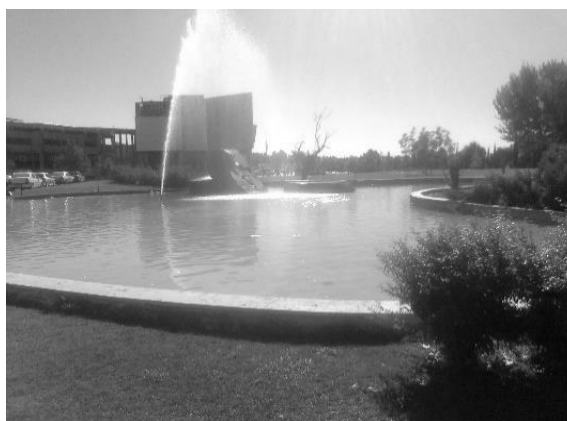
شکل ۱- نمای بیرونی و داخلی از مدرسه امام رضا در شیراز Fig.1- Exterior and interior of Emamreza school in Shiraz