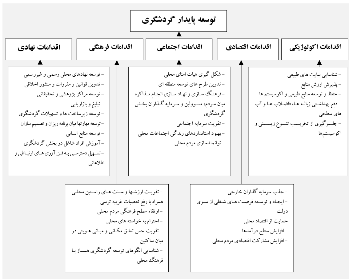
شکل ۳- اقدامات موثر در نیل به توسعه پایدار گردشگری

در بسیاری از جوامع پیشرفته، گردشگری از جایگاه ویژه ای برخوردار است و حتی در برخی کشورها نیز مانند ترکیه، اسپانیا، ایتالیا و چین، گردشگری به عنوان منبع بسیار مهمی در اقتصاد آن