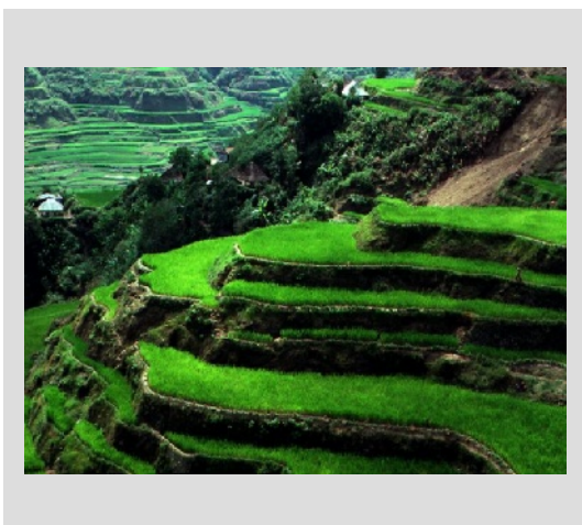
شکل ۳- زمینهای کشاورزی نمونه ای از اختلالات منفی در منظر- بعنوان عامل کنترل و کاهش میزان پیچیدگی