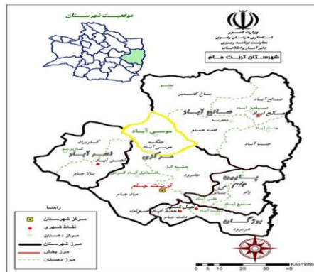
شکل ۲- موقعیت جغرافیایی منطقه موسی آباد Fig. 2- Geographical location of MusaAbad area

است. با توجه جامعه مورد مطالعه (۲۶۸۳ نفر جمعیت و ۵۶۰ خانوار) و به کمک فرمول کوکران، تعداد ۲۲۸ خانوار به‌عنوان حجم نمونه تعیین شدند. در مرحله بعد، به روش سیستماتیک تصادفی جهت پراکنش مناسب نمونه‌ها در سطح روستاها، و سپس با مراجعه به همان منازل مشخص شده روی نقشه، نمونه‌ها مورد آماربرداری و پرسشگری قرار گرفتند. روایی پرسشنامه از نظر صوری مورد تأیید